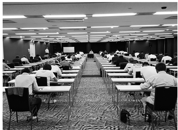
下水道管路更生管理技士 資格試験試験風景

そのために品確協は、管路更生工事の施工における技術の向上、品質の確保を目的として、更生管の設計、施工、品質管理等の基礎的な知識を確認する一次試験と、実際に施工管理する上で必要な工法の特徴とノウハウを学ぶと同時に、知識を確認する二次試験を行い、一次試験の資格試験合格証と二次試