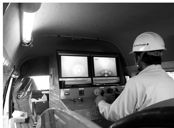
穿孔作業のようす