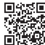
品確協ホームページのQRコード